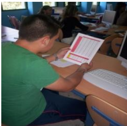
Foto: alumno mostrando el cuadro de la información de la venta de valores.