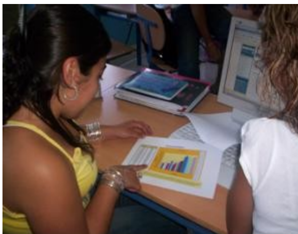
Foto: alumnas mostrando la representación gráfica de las cotizaciones de la empresa BBVA

La explicación de cada gráfica se debe hacer, a ser posible, relacionando las variaciones de las cotización de las acciones con sus causas o factores, para ello se debe buscar información específica de cada empresa que explique dicha evolución, por ejemplo, adquisición de otra empresa, anuncio de reparto de dividendos, comunicación de resultados, anuncio de expansión a otras zonas geográficas... Factores como estos influyen en el precio de las acciones tanto positiva como negativamente.