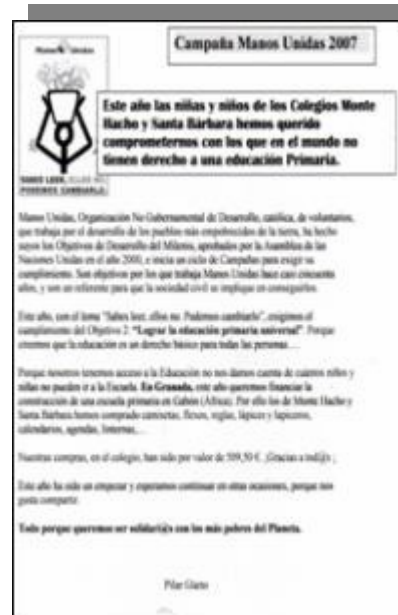
Noticia sobre la Campaña de Manos Unidas en el Colegio