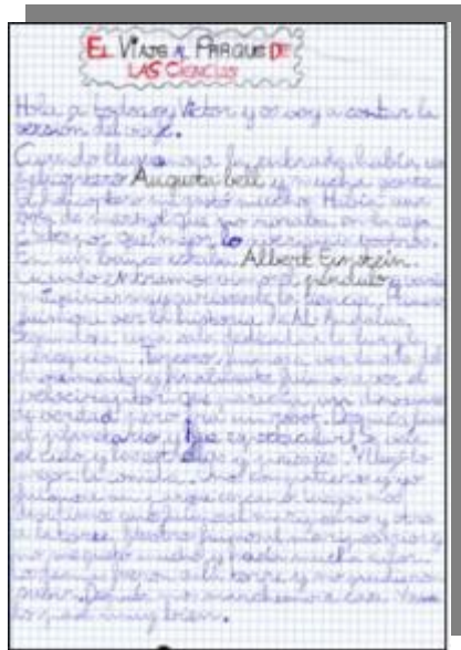
Redacción sobre la visita al Parque de las Ciencias