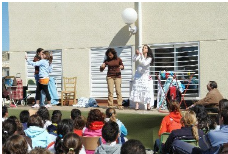
Representación teatral que pone de manifiesto la desigualdad en el reparto de tareas.