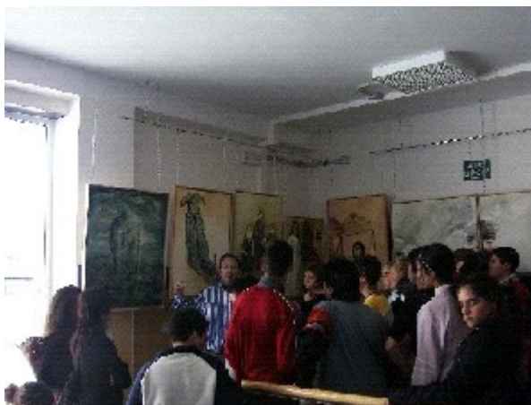
Exposiciones de artes plásticas (actividades realizadas durante el primer trimestre, para la concienciación de la violencia de género)