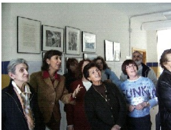
Día internacional de la mujer, Jornada de puertas abiertas: Asociación de Mujeres Ana Orantes, madres y abuelas de nuestro alumnado