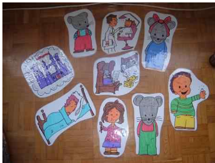
ACTIVIDAD Nº 3