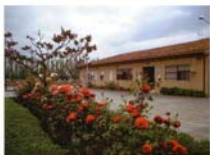
Mi pueblo: Albolote