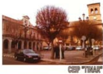
Albolote natural, Andalucía natural